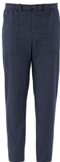
J004 Jeans blu